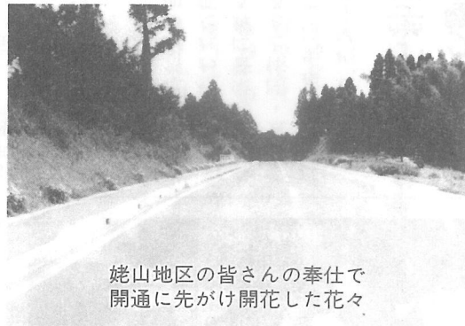
姥山地区の皆さんの奉仕で 開通に先がけ開花した花々

7年余りの歳月と、9億円近く の巨費を投じ、大総地区の山間部 へ建設を進めてきた町道坂田遠山 線の改良工事が、いよいよ今夏を もって完了し、秋には開通の運 びとなりました。