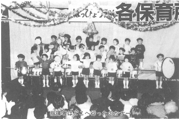
指揮者はどこへ行ったのかナー