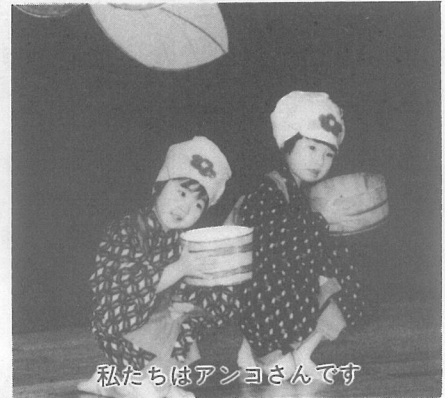
私たちはアンコさんです