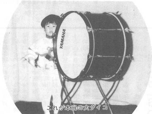
これが本当の大ダイコ