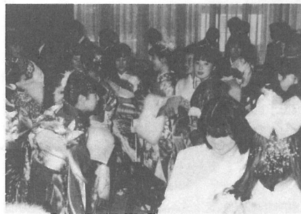
久しぶりの再会に話はずみずみ