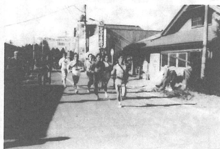
今年の栄冠はどのブロックに？