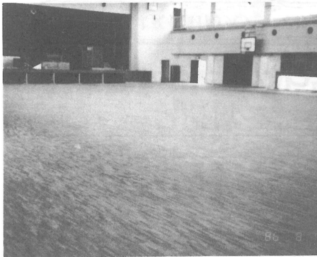
きれいに張替えられた横芝小学校体育館床