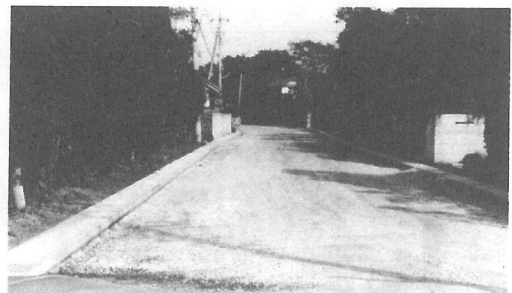
みなが見ている幹線道路の整備(町道新青東線)

湿地で泣いた住民も 数年後には安心して 農業にいそしめます (屋形地区土地改良 事業)