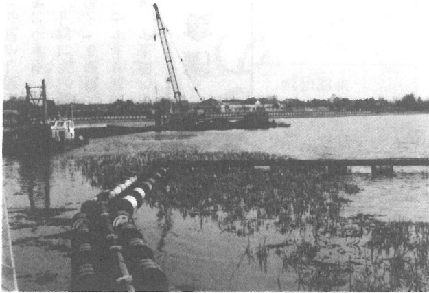
坂田池改修工事が本格的に始まりました。 改修工事終了後は、町で池の周辺を徐々に 公園として整備していきます。