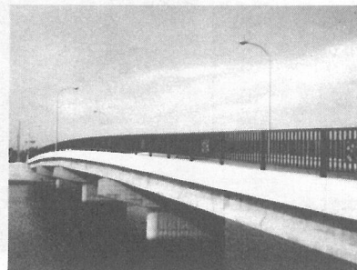
架け換えられた 新屋形橋 (5月19日 竣工)