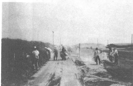
観光の時期を控え みんなで行った 海岸清掃 (7/11)