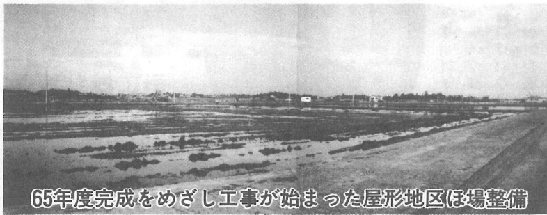
65年度完成をめざし工事が始まった屋形地区ほ場整備