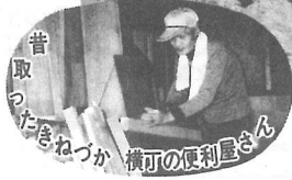
昔取ったか ねづか 横町の便利屋さん