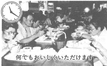
何でもおいしくいただけます