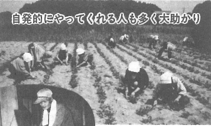
自発的にやってくれる人も多く大助かり