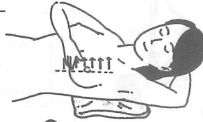
① ▲乳房の内側半分を調べる 腕をのばして頭の下に入れ、揃えた三本の指の腹を使って調べます。

検査するほうの肩の下に折りたたんだタオルなどを入れ(乳房の小さい人は、必要ない)、乳房が胸の上で平たく広がるようにします。次の要領で左右の乳房を調べてください。