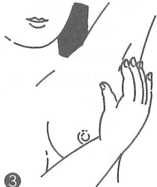
③ ▲わきの下を調べる わきの下に三本指をさし入れて、指先を胸壁にそってゆっくりすべらし、リンパ節がはれていないか調べます。