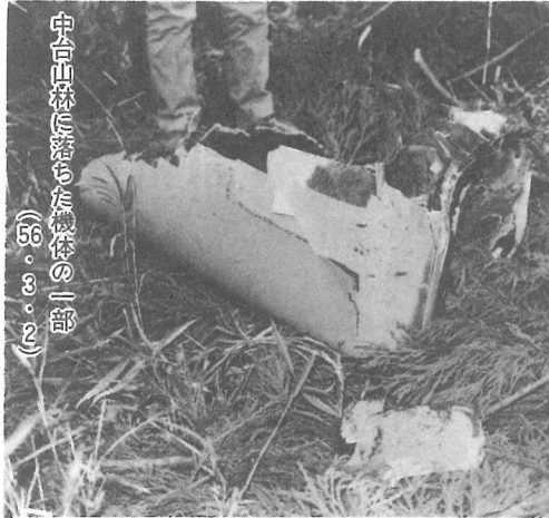
中山山に落ちた機体の一部 (56.3.2)