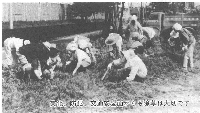
美化、防犯、交通安全面からも除草は大切です

ゴミゼロ5・30運動が定着してきましたが、今年度1回目の1日清掃が6月7日に行われます。皆さんのご協力をお願いします。