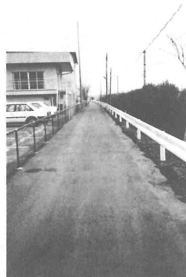
安全な暮らしを守るため 各所に設けられた転落防止ガードレール