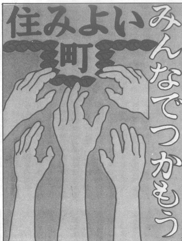
〈明るい選挙啓発最優秀作品〉