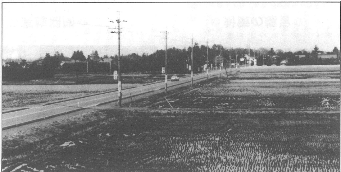
この集落は、谷津川(幹線10号排水路)をへだてて蓮沼村と接している。横芝・上堺線と飯岡・片貝線の両県道が交差し、夏には海水浴客のマイカーなど、賑わいをみせる交通の要衝である。

この集落は江戸時代、屋形村に属して、本郷(宮前)の南側に位置するために、「南」と呼ばれたと伝えられます。元禄(1688~1704)以降、地引網漁業の発展とともに、海南部に「枝村(納屋)」が置かれました。 現在は、水稲をはじめ、畑作・施設園芸を中心とした静かな田園地帯で、果樹ほ場整備事業が計画されるなど、農業の近代化も進められています。(28世帯)