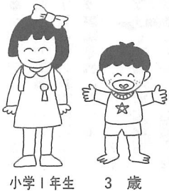
小学1年生 3 歳