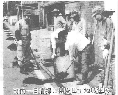
町内一日清掃に精を出す地域住民

防災・消防体制および交通安全・防犯対策を充実させ、日常生活を取り巻く災害や事故などの危険から町民の生命・財産を守り、安全を確保します。そして、誰もがいつでも安心して生活できるまちをめざします。