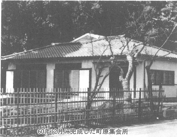
60年12月に完成した町原集会所