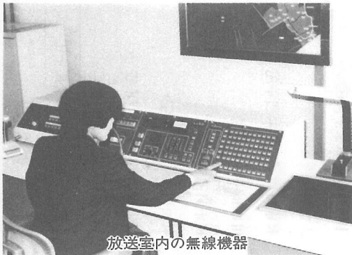
放送室内の無線機器

「災害は忘れた頃にやってくる」——地震や津波、火災など、突然襲って来る災害の全てを完璧に防ぐことはなかなか難しいことです。しかし、私たちの日々の努力で被害を最小限に防ぐことは可能です。このためには、確かな情報をいち早く皆さんにお知らせし、町と町民皆さんが一体となった防災活動を繰り広げる必要があります。そこで町では、このほど「防災行政無線」を設置し、非常事態に