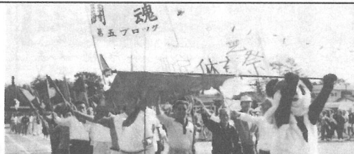
今年も賑やかな入場行進や応援合戦が見られることでしょう。(写真は昨年入場行進より)

10月5日(日)に横芝中学校で行われます。ふれあい健康づくりにつながる参加してください。 (雨天の場合は10日)