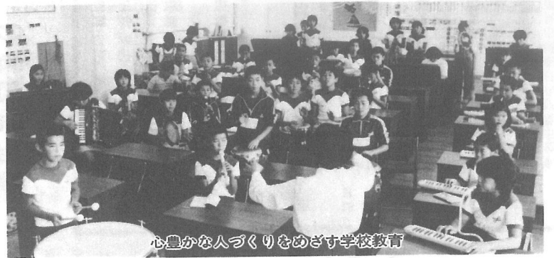
心豊かな人づくりをめざす学校教育