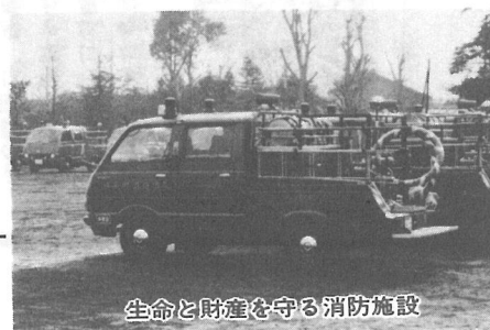
生命と財産を守る消防施設