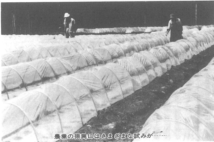
農業の振興にはさまざまな試みが……