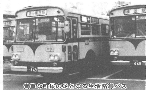
貴重な町民の足となる生活路線バス