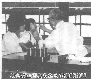
安心な生活をもたらす健康診査