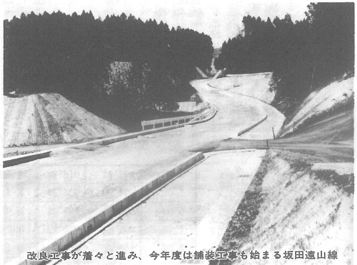
改良工事が着々と進み、今年度は舗装工事も始まる坂田遠山線