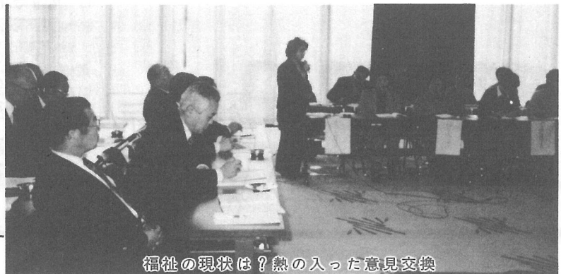
福祉の現状は？熱の入った意見交換