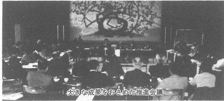
大きな成果をおさめた推進会議