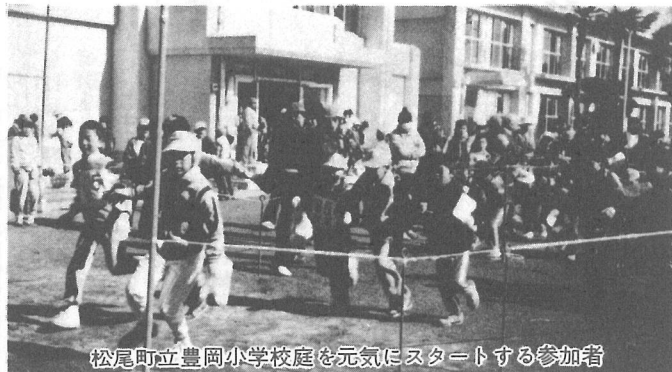
松尾町立豊岡小学校庭を元気にスタートする参加者