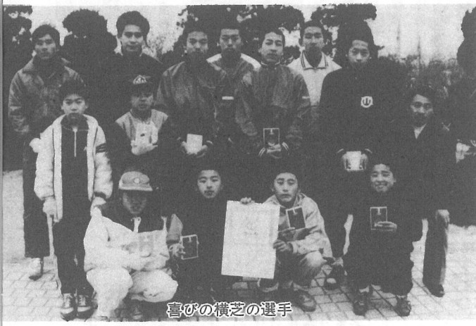
喜びの横芝の選手