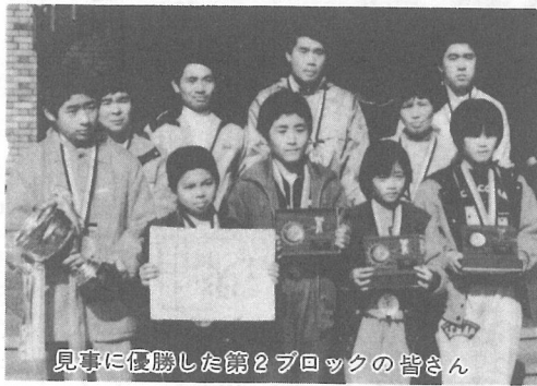
見事に優勝した第2ブロックの皆さん