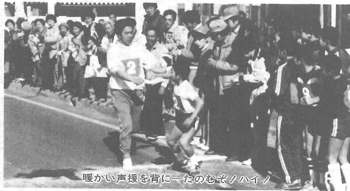
暖かい声援を背に一たのむぞ／ハイ／

新春を飾る「町駅伝大会」が1月19日、中台十字路から屋形保養センターまでの10区間15・7キロのコースで行われ、13ブロック130人の選手が健脚を競いました。選手たちは、沿道を埋めた地元民や駅伝ファンを声援を背に受けて力走。3区で一挙に首位に躍り出た第2ブロック（取立・長倉・姥山・遠山）が4区から早くも独走態勢に入り、2位と3分余りの差をつけてゴールイン。55分39秒の好タイムで優勝しました。