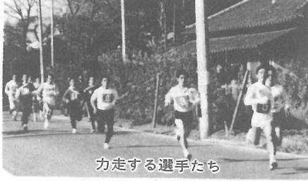
力走する選手たち