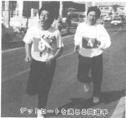
デットヒートを演じる両選手

優勝=第2ブロック 準優勝 =第7ブロック 3位=第5 ブロック 4位=第1ブロッ ク 5位=第11ブロック