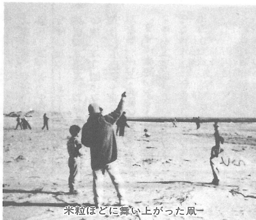
米粒ほどに舞い上がった凧

1月12日、屋形海岸で「新春子ども凧あげ大会」が行われ、50名の子どもたちが手作りのを持ち寄り参加しました。ほど良い風に乗って大空に舞う凧、バランスをくずし回転してしまう凧。そこには、親子のほほえましい姿もありました。