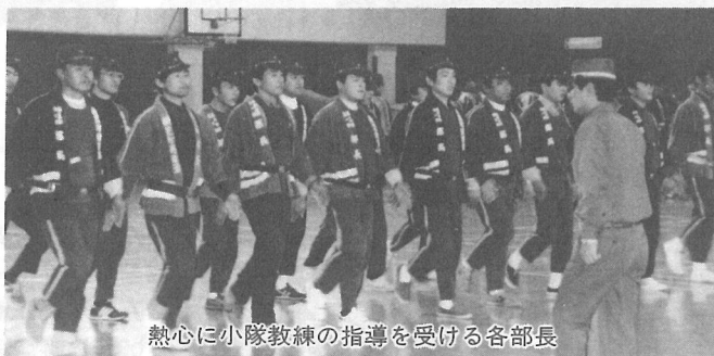
熱心に小隊教練の指導を受ける各部長

部長と団本部役員による出初式の訓練を兼ねた規律訓練が、12月8日に横芝小学校講堂で行われました。 当日は、雨のため急きょ屋内での訓練になり、みなさんはとまどいぎみでしたが、消防署員の適切な指導を受けて、小隊教練などの規律訓練に励んでいました。これで、新春の出初式は整然と挙行されることでしょう。