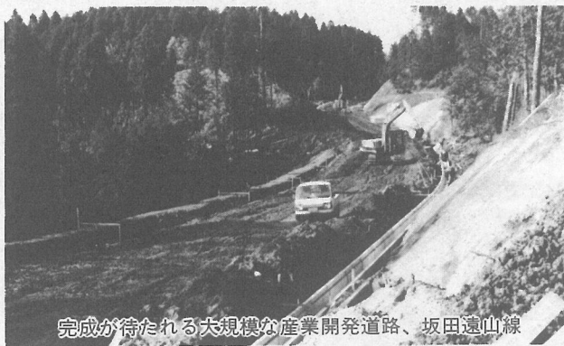
完成が待たれる大規模な産業開発道路、坂田遠山線