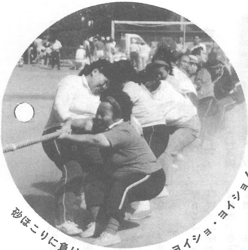
砂ほこりに負けてはいられない ヨイショ・ヨイショ!