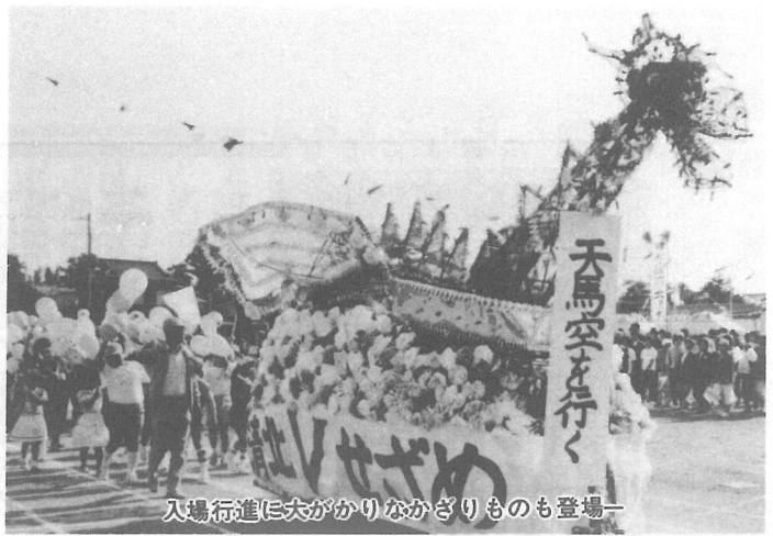
入場行進に大がかりなかさりものも登場—