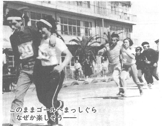
このままゴールへまっしぐら なぜか楽しそう—