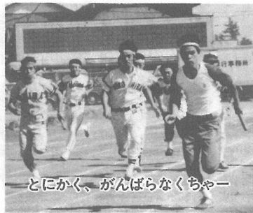
とにかく、がんばらなくちゃー