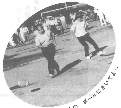
ホールのきいてよ〜 ネエ〜どこへ行くの