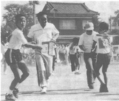
まったく勤が狂ちゃう でもいい線いったね!

雨にたたれ、翌週に延期された第17回横芝町民体育祭は、10月13日(日)横芝中校庭で行われました。時折り強風が吹き荒れ、砂ほこりが舞う悪コンディションの下、リレーや綱引きなど32種目の競技が次々と繰り広げられました。そしてアトラクションとして、大総小生徒のマスゲーム・鳥喰上新田若連のお囃子・婦人会の踊り等も披露され、体育祭に華をそえました。 また、今回から応援賞が設けられたこともあって、各ブロックとも趣向をこらした応援が終始、賑やかに行われ、見て楽しいお祭りムードいっぱい町の体になりました。