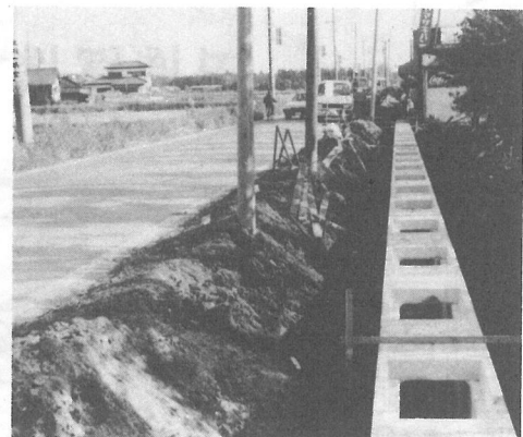
歩道設置工事が始まった鳥喰新田地先(横芝小学校下)