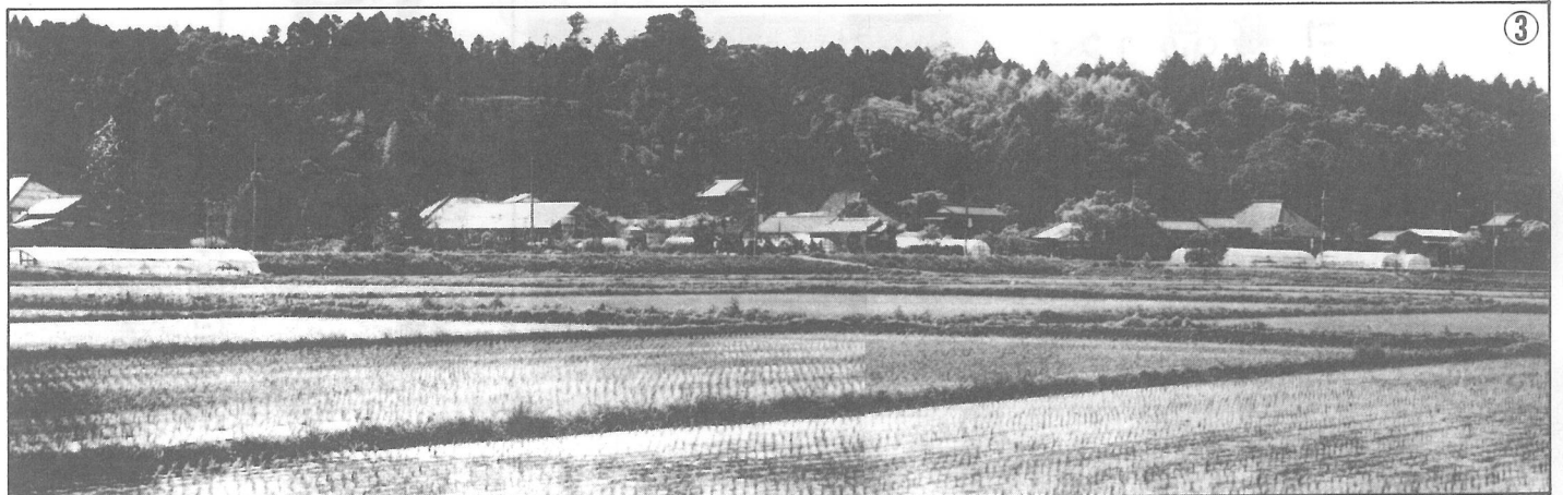
③広大な耕地を眼前に、緑豊かな丘陵を背に、多古街道に連なる小堤の集落は、いまだに山里の風情を残している。