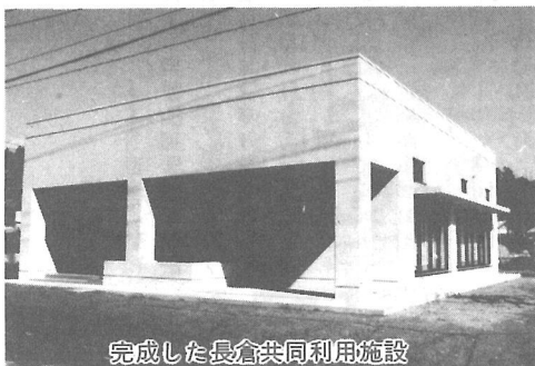
完成した長倉共同利用施設