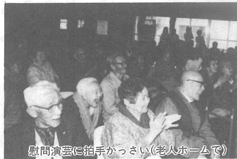
慰問演芸に拍手がっさい(老人ホームで)

昭和59年度の「歳末たすけあい募金」は、皆さんの暖かいご協力で、96万9、519円という大きな成果をあげることができました。寄せられた義援金は、さつそく恵まれない方々のために使わせていただきました。今回の募金の結果をご紹介します。