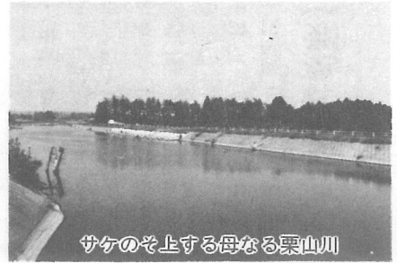
川のそ上する母なる栗山川