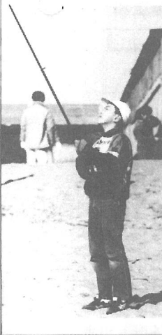
走ったり、つりざおを使ったり、 あげ方もいろいろですね

1月6日に、屋形海岸で「新年 子供たこ上げ大会」が開かれまし た。参加した62人の子供たちは、 それぞれが工夫を凝らした手作り だこを持参し、雲一つない快晴の 大空に泳がせていました。