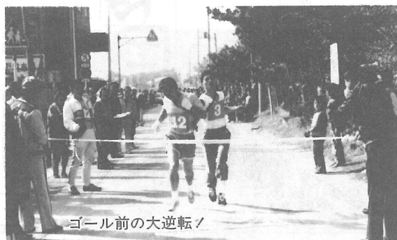
ゴール前の大逆転！