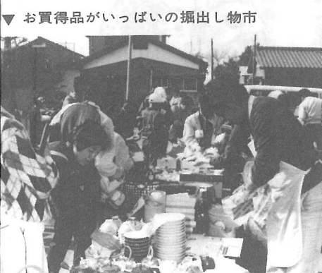
▼ お買得品がいっぱいの掘出し物市