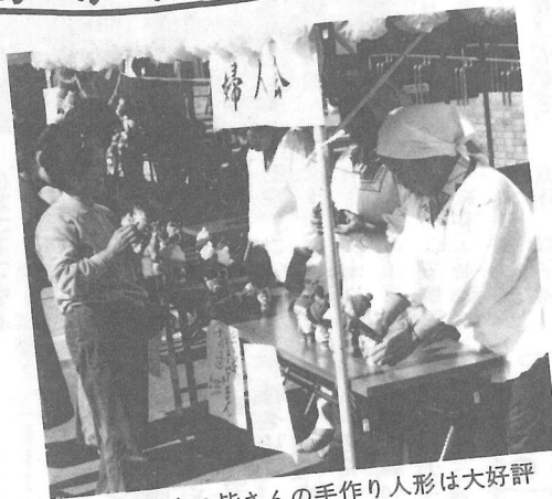
▲ 婦人会の皆さんの手作り人形は大好評