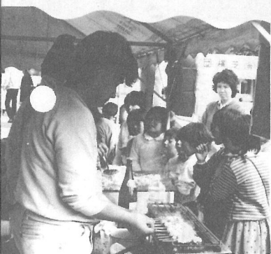
▲ 「お兄さん、まだできないの？」 —青年団の焼そば・焼鳥は売れ行き上々