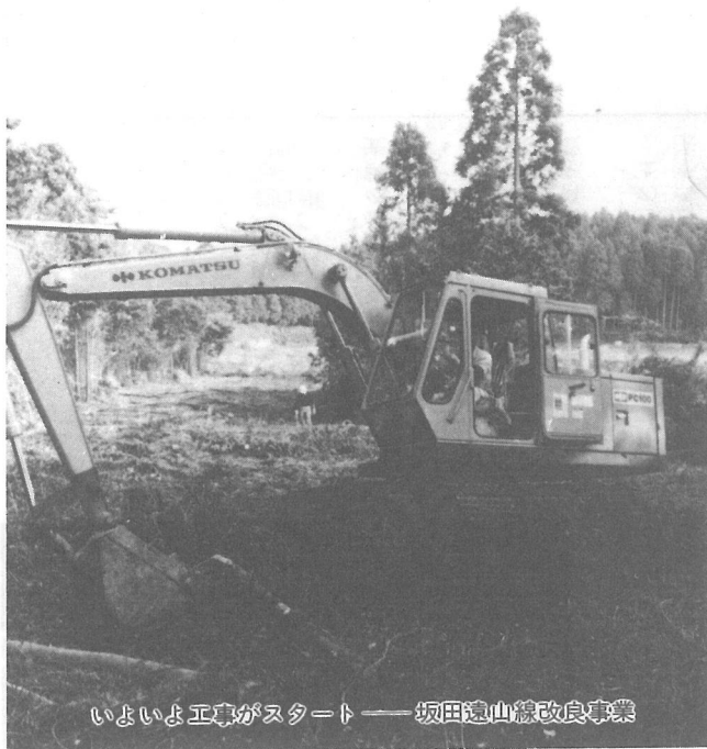
いよいよ工事がスタート——坂田遠山線改良事業