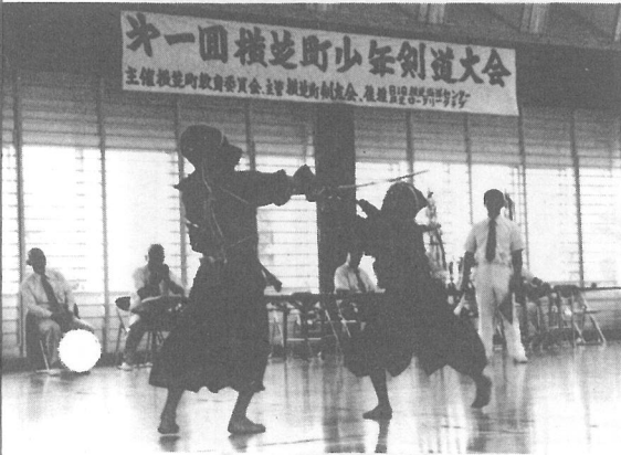
↑「メンノ」——気合いがこもる一瞬

最近、小・中学生の間で剣道は大人気と か——そんな剣道ブームを反映して、9 月9日(日)に横芝海洋センターで開かれた 「第1回横芝町少年剣道大会」には、近隣 9市町村から200人の剣士が集合しまし た。横芝町は団体戦全種目、個人戦で中学 生女子がそれぞれ優勝するなど、圧倒的な 強さを見せました。会場には、選手・応援 団合わせて400人以上の熱気と汗と歓声 が、1日じゅう飛び交っていました。