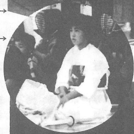
試合を見つめる真剣な目