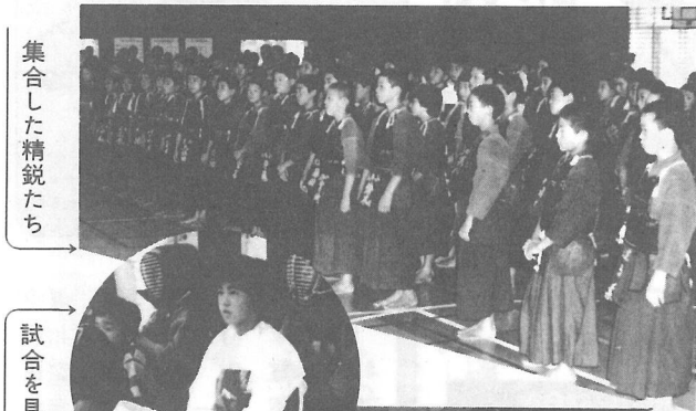
集合した精鋭たち