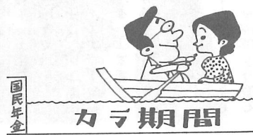
国民年金 カラ期間

答 国民年金以外の公的年金(厚生年金や共済組合など)に加入している人の配偶者は、国民年金に加入してもしなくてもよいことになっています。(任意加入制度) これらの任意加入者が、国民年金に加入しない場合でも、その期間は「カラ期間」といって、年金を受けるのに必要な期間として計算されます。(ただし、この場合は