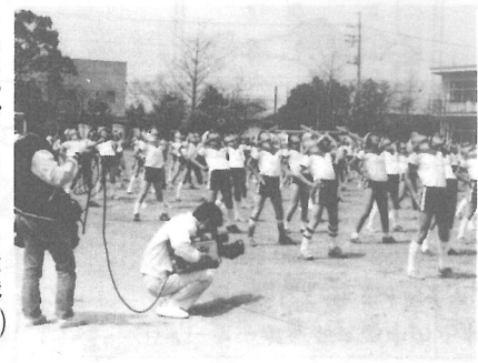
ちよっぴりカメラを意識(?)

たちはちよっぴり緊張のようすでした。(番組は5月14日から20日まで放映されました)