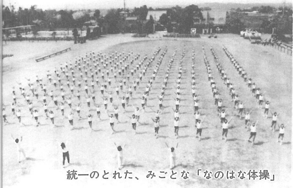
統一のとれた、みごとな「なのはな体操」

これは、同局で毎日放映している「テレビなのはな体操」のために収録したもので、この日「モデル」となったのは5・6年生310人の皆さん。収録は30分ほどで完了しましたが、向けられたテレビカメラに、子供