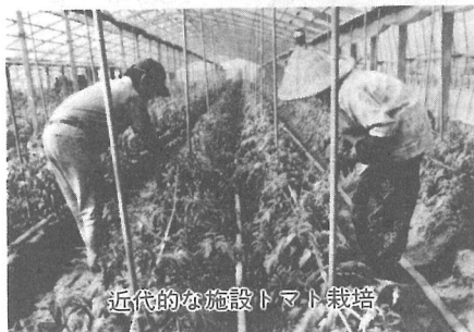
近代的な施設トマト栽培

農業生産を向上させるため、生産基盤の整備を重点的に行うとともに、商工業・観光の振興を図って、均衡のとれた産業の発展をめざします。