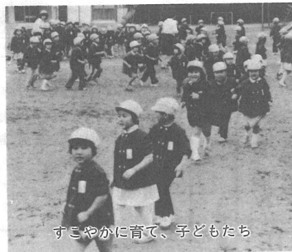
すこやかに育て、子どもたち