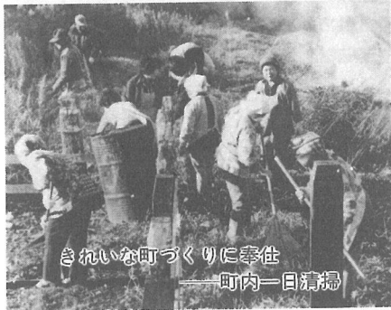
きれいな町づくりに奉仕 ——町内一日清掃

快適で安全な暮らしの実現を図るため、日常生活に密着したごみ・し尿の処理、集会施設の建設、消防・防災・航空機騒音対策などを、積極的にすすめていきます。