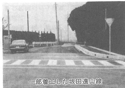
一部着工した坂田遠山線