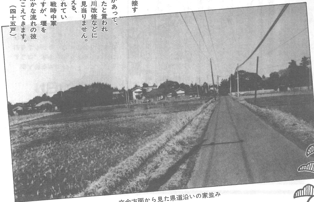
立会方面から見た県道沿いの家並み