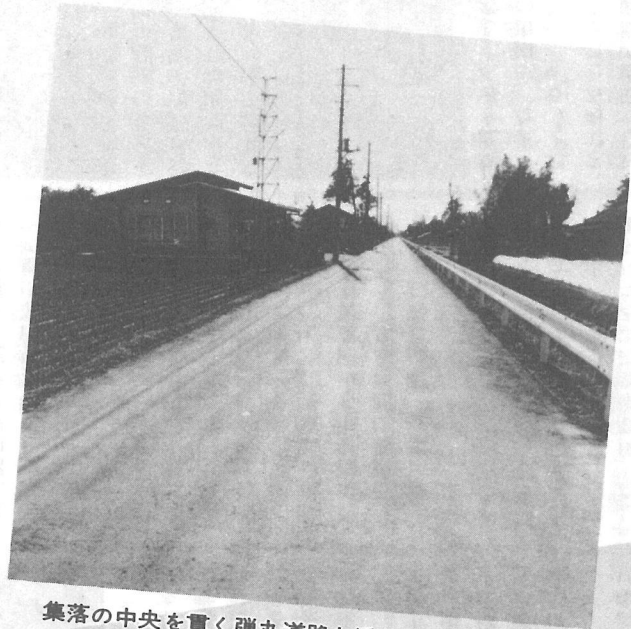
集落の中央を貫く弾丸道路と近代的な集会施設

その名の示すとおり、昔はあたり一面広大な湿地帯で、さまざまな野鳥・水鳥が棲息していました。大正の初期から後期にかけての、沼の干拓・耕地整理により、現在の農耕地や集落がかたちづくられました。 松尾町と連結する中央の道路は、俗に色川道路と呼ばれていますが、これは大変な難工事を見事に成し遂げた業者への敬意から、誰言うとなくその名をもじって呼ぶようになったとのことです。 この道路も、現在は五メートル舗装の立派な道路に生まれ変わり、時の流れを感じさせます。