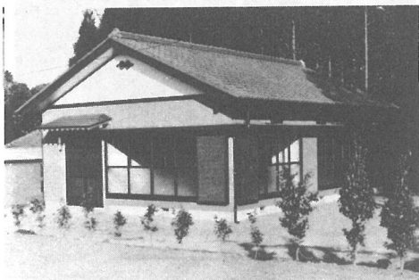
完成した桜前集会所

町戦没者追悼式が、十一月二十六日、横小講堂に三五〇柱の遺族の方々と来賓多数を招いて、しめやかに行われました。 「毎年追悼式に参列するたびに、悲しみがよみがえってきます。私たちを守るために、戦地に赴いた夫や兄弟のことを思うにつけて、今日の平和を感謝せずにはいられません」と、参列