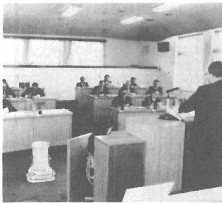
人事院の勧告に基づく国家公務員の給与改定と県職員の給与