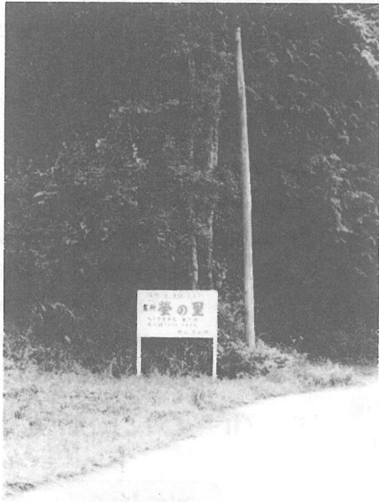
▲ だれが建てたかわからない名所螢の里と書かれた看板

七月二十日の十一時ごろ、町民の方が、わざわざ見られて「きょう、姥山と遠山の境あたりに、名所、