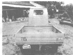
【うしろに付けられたナンバーが原付であることを証明している】

Bespaについて伊藤さんは「オートバイでは雨ふりの日に困るので、親類の紹介で、昨年十二月に買いました。原付の免許で乗る