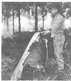
▲中台の山林に落下したフラップカバー

昨年六月から今年の三月にかけて、航空機から氷塊や、フラップカバーが落下しました。さいわいに、民家や人体への被害はなかったものの、相次ぐ落下物によって、飛行直下にあたる中台地区の方が、恐怖と不安の毎日を送っています。