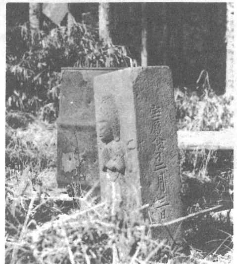
▲(2) 宝曆八……という字がはっきり読みとれます。

庚申様は、比較的多く見かける青面金剛を主尊として正面に、側面には、宝曆八戊子二月三日、と刻まれて見えます。建立者名称が見えないのは、やはり台座に刻まれている人名が建立者だと思えます。尚、「刁」という字画は多分年