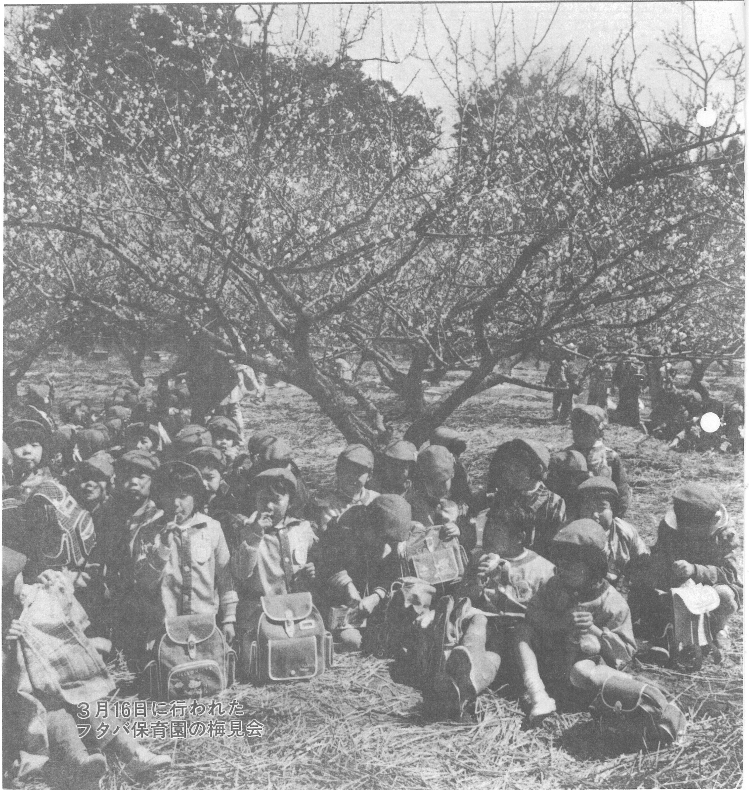
3月16日に行われた フタバ保育園の梅見会