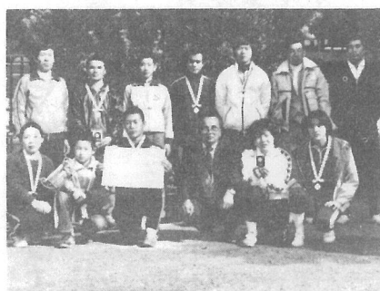
第六回を迎えた町駅伝大会は、一月十八日に行われ、栗山チームが五十七分一秒という大会新記録