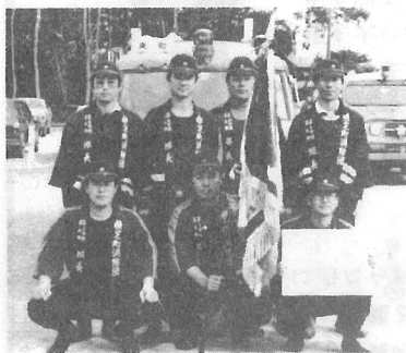
第五回横芝町消防ポンプ操法大会が、十一月二日に、町民のひろばで行われました。 この大会は、日ごろ訓練した操

上堺小)と光浄水場(横芝小)をそれぞれ見学しました。 この見学会は、どのようにして水が作られ、家庭まで届くのかを知ってもらい、衛生思想の向上と水道に対する正しい知識を深めていただくとうと、山武郡市広域水道企業団が行っているものです。 見学をした子どもたちは、日ごろ思っていることを、さかんに聞いたり、メモしたりしていました。