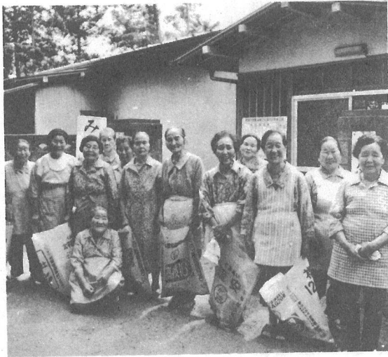
▲南川岸の青年館前に集まった老人クラブのみなさん。 これからは、アキ缶の投げ捨てが多くなる時期です。これからもお願いします。

自分たちの部落からゴミをなくそう。と南川岸老人クラブ(老人)のみなさんは、毎月一回部落内のアキ缶やゴミなどの収集を行っています。