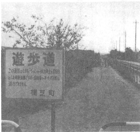
▲ 横芝1号線下の遊歩道が全線でできあがりました。みんなで利用しましょう！