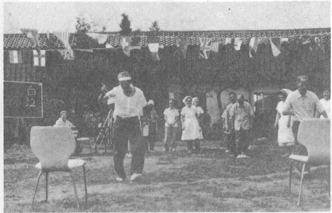
▲ 赤かて 白かて 老人ホームで運動会 楽しい一日でした