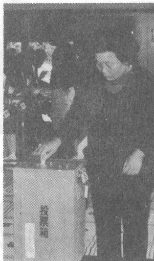
▲この1票が明るい県政を築く(寺方青年館で)

○長期譲渡所得にかかる個人の町民税の課税基準額が二千万円から四千万円に、また今まで二千万円以下のものに課せられていた税率四パーセントが、三・四パーセントに改正されました。 ○国民健康保険税の課税額の上限が十九万円から二十二万円に、